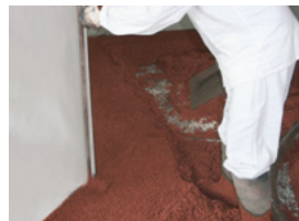
Izraditi kutne visine, (fašne) nasipati, zbiti i poravnati visinu.