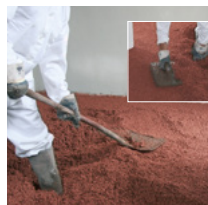
Priključne rubove prema zidu naknadno obraditi, a naneseći materijal na površinu zbiti.